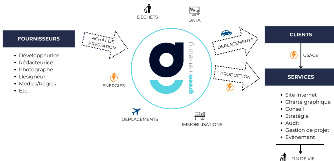
Figure 1 - Cartographie des flux de l'activité de Green Marketing Réunion